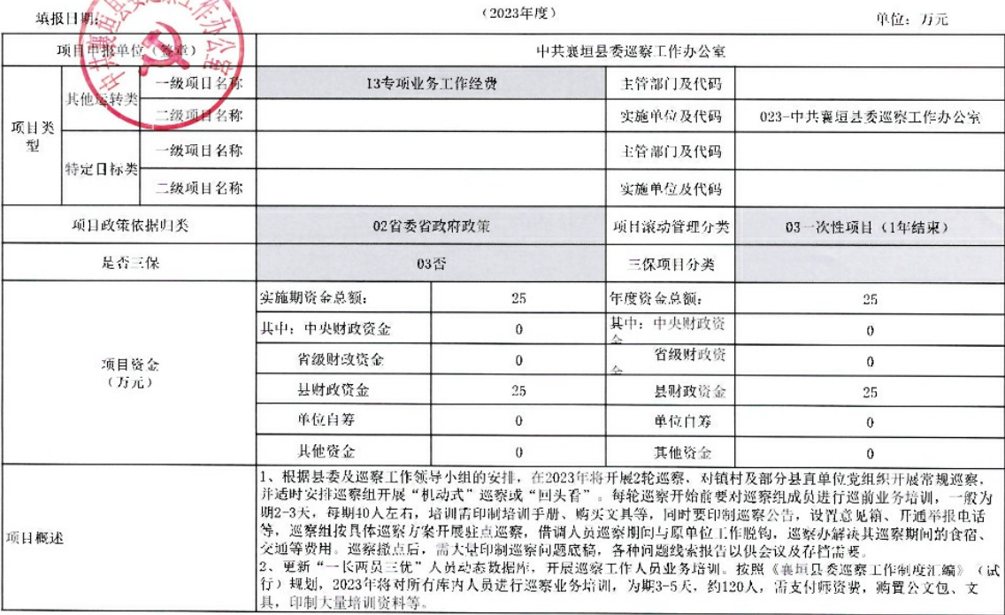
襄垣县预算部门（单位）县级项目入库及绩效目标申报表