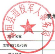
襄垣县部门（单位）项目支出绩效目标表