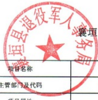
襄垣县部门(单位)项目支出绩效目标表