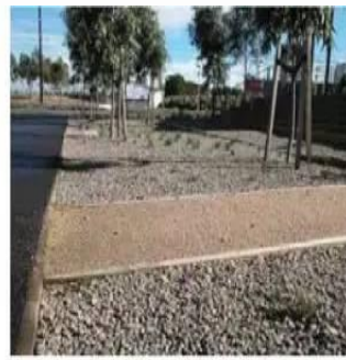
透水性地面停车场